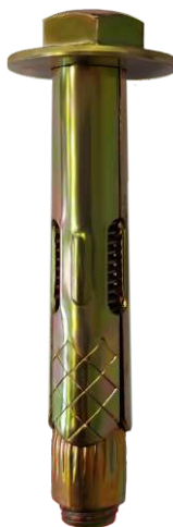
Анкерный болт 10x60